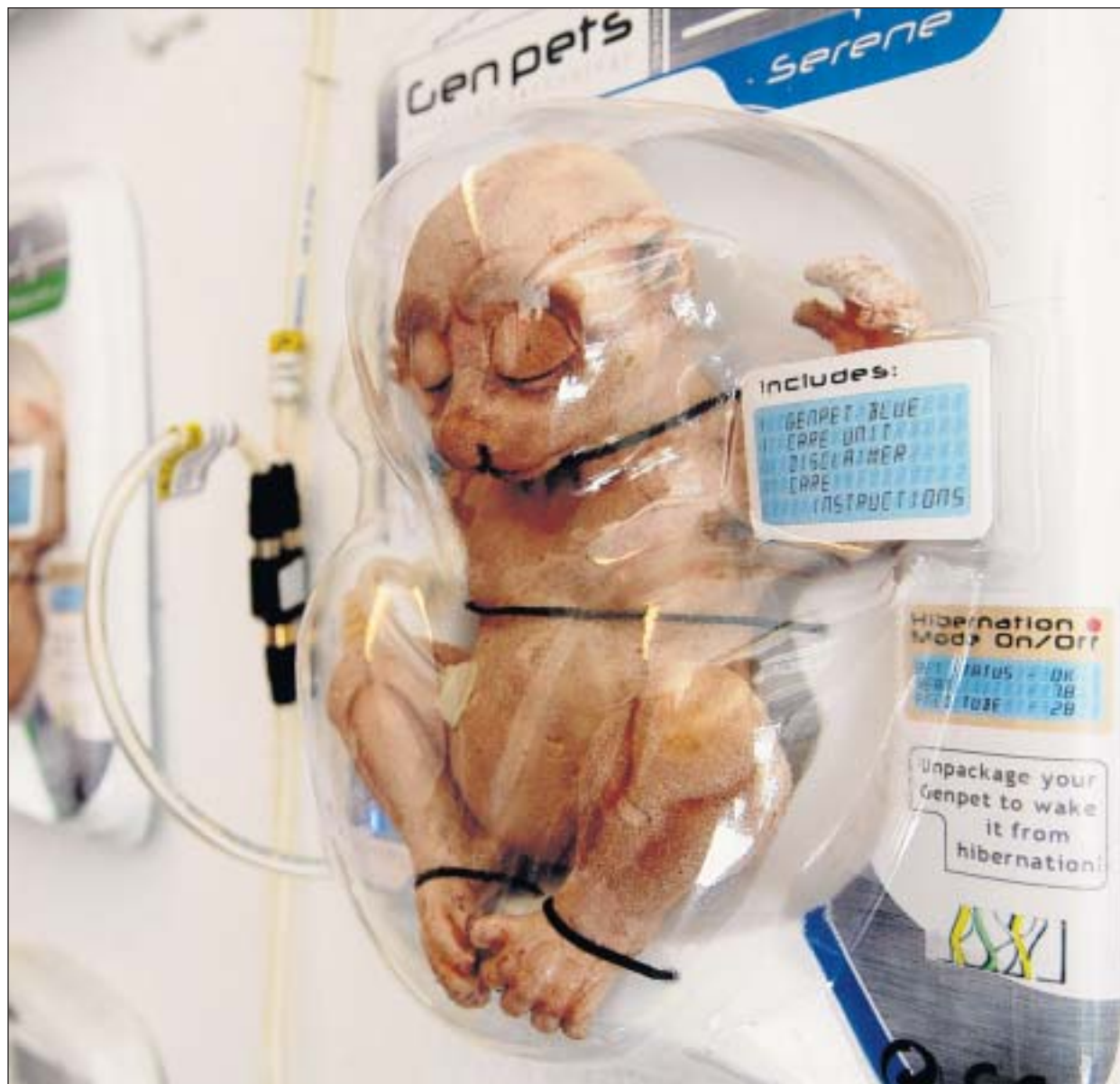
Wirken abstoßend: Genpets – die Bachelor-Arbeit eines kanadischen Studenten.